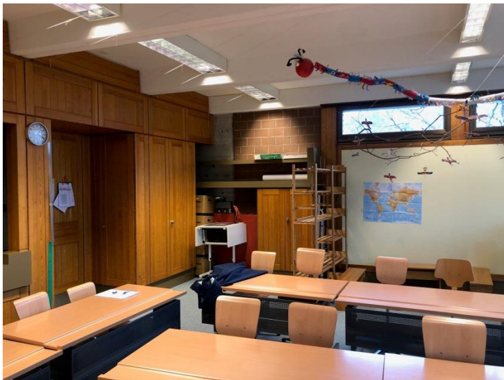
Bild 3: heutiges Klassenzimmer im Schulhaus A Walenbach – neues Handarbeitszimmer