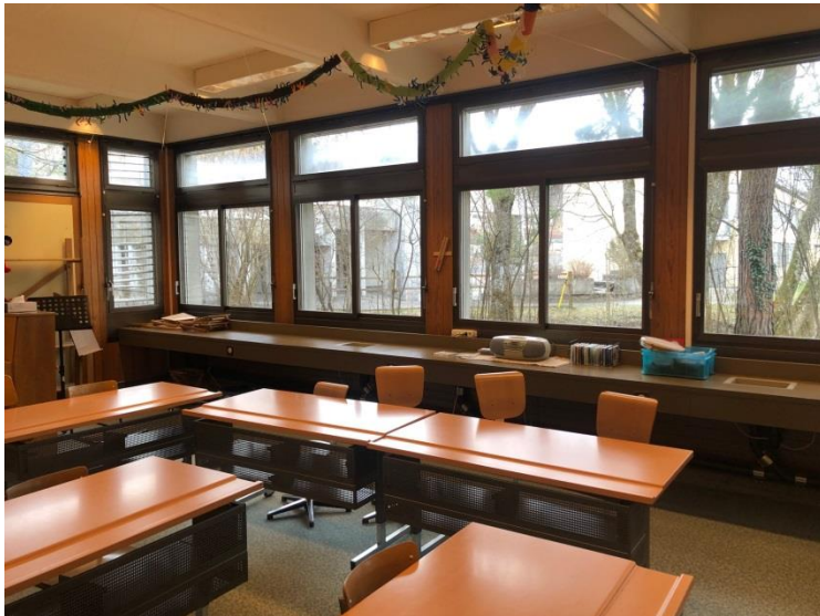
Bild 2: heutiges Klassenzimmer im Schulhaus A Walenbach – neues Handarbeitszimmer