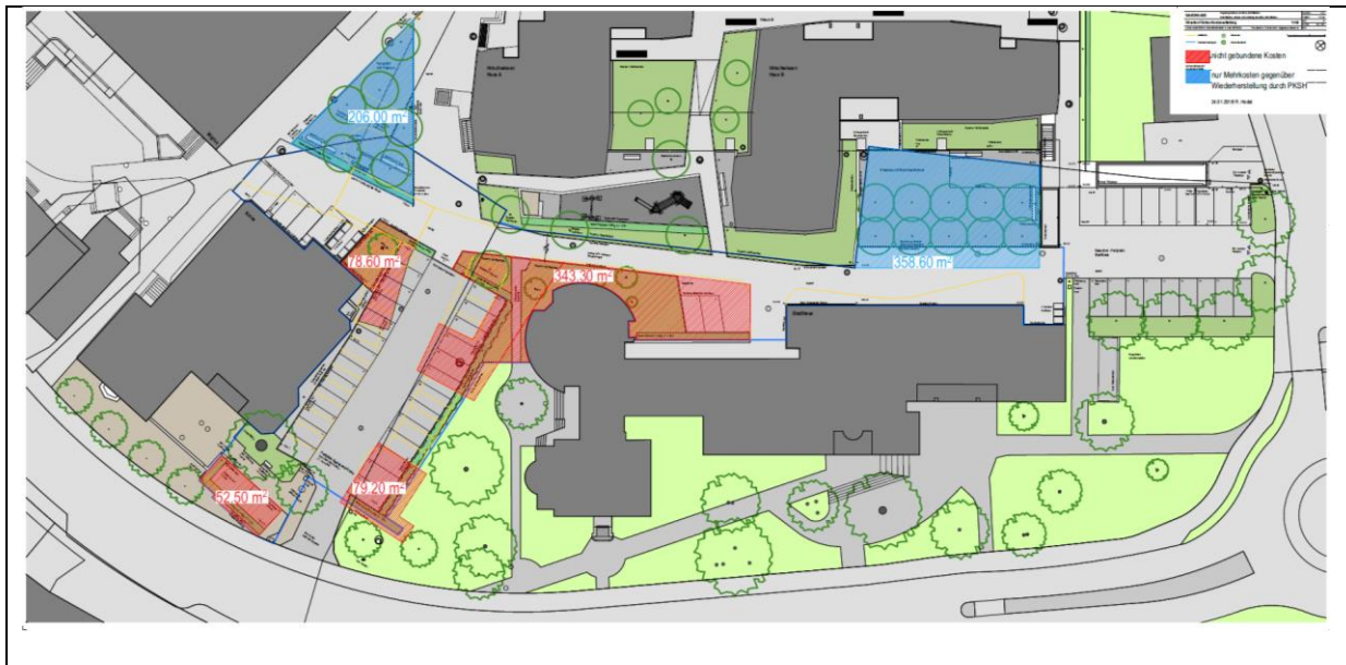
Bild 3: Aufteilung gebundene resp. ungebundene Flächenanteile (orange = nicht gebunden, blau = Mehrwert)