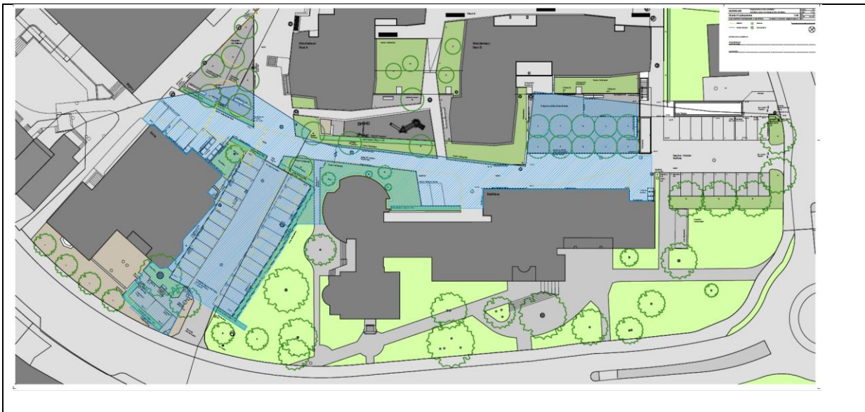
Bild 1: Perimeter Umgebungsarbeiten Stadt Wetzikon, blaue Schraffur