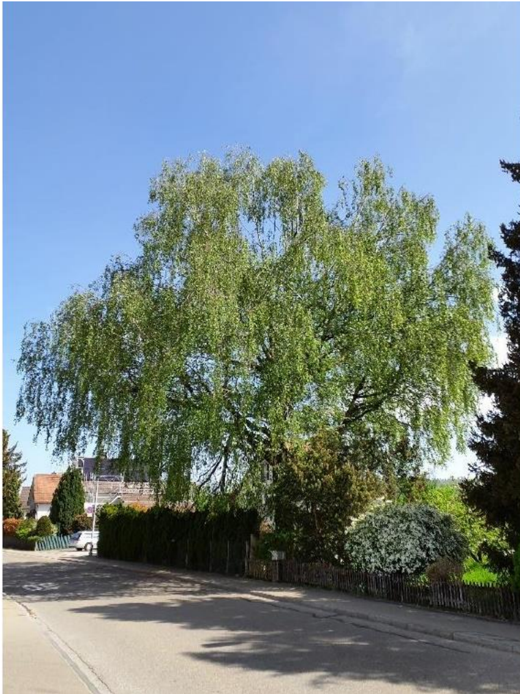
Abbildung 2: Inventarisierte Birke NLI 4.127, Buchgrindelstrasse 20.

Die Gemeinde ist verpflichtet, bei Baubewilligungen dafür zu sorgen, dass Schutzobjekte geschont und – falls das öffentliche Interesse überwiegt – ungeschmälert erhalten bleiben. Deshalb hat der Stadtrat am 26. Juni 2024 gestützt auf § 209 Abs. 2 des Planungs- und Baugesetzes über die inventarisierte Birke das Inventar eröffnet und die Birke vorsorglich unter Schutz gestellt. Damit ist ein einjähriges Veränderungsverbot in Kraft getreten (Stadtratsbeschluss 2024/163). In dieser Frist hat die Stadt Wetzikon abzuklären, ob es sich beim Baum tatsächlich um ein Schutzobjekt handelt und Schutzmassnahmen ergriffen werden müssen. Um Aufschluss über die Schutzwürdigkeit des Baumes zu erhalten, hat die Abteilung Umwelt bei der Quadra GmbH ein naturschutzfachliches Gutachten in Auftrag gegeben.