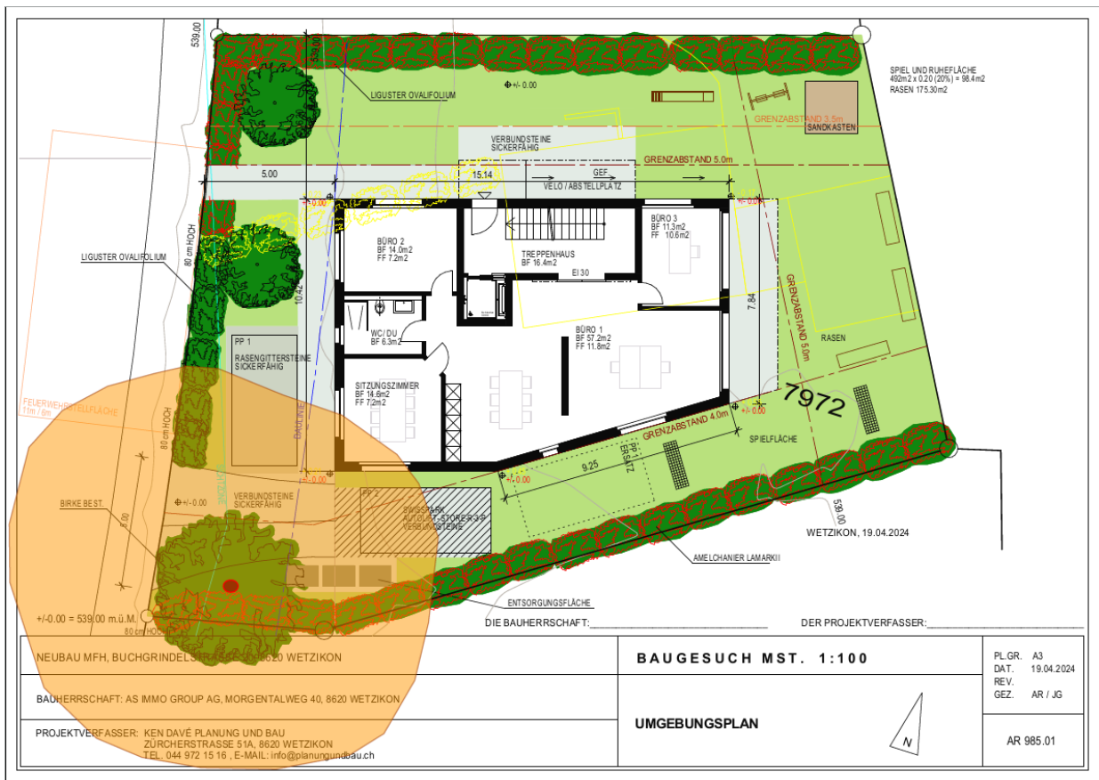
Abbildung 1: Umgebungsplan vom 19. April 2024. Orange eingefärbt: ungefähre tatsächliche Baumkronendimension

Gemäss dem Objektblatt Nr. 4.127 des Natur- und Landschaftsinventars (Stand 2014) prägt die markante Hängebirke das Strassenbild. Sie wurde als "sehr wertvoll" bewertet. Das Schutzziel ist gemäss Objektblatt der Erhalt des Baums.