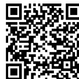
Google Play Store