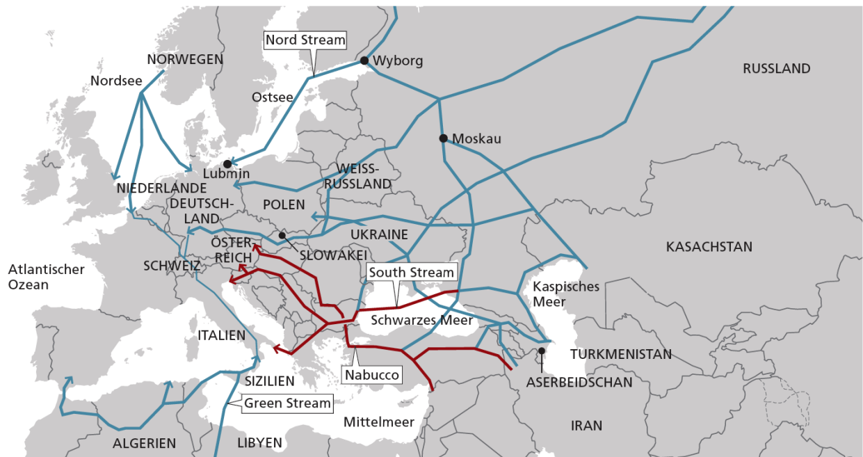
Gasleitungen nach Europa: — Hauptversorgungsleitungen, — projizierte Leitungen

Eine gewisse Unabhängigkeit wird mit dem gut speicherbaren LNG (liquefied natural gas) sichergestellt. Bereits heute wird flüssiges LNG meistens mit Schiffen, insbesondere auch aus Algerien, in verschiedenen Häfen in das europäische Gasnetz eingespeist.